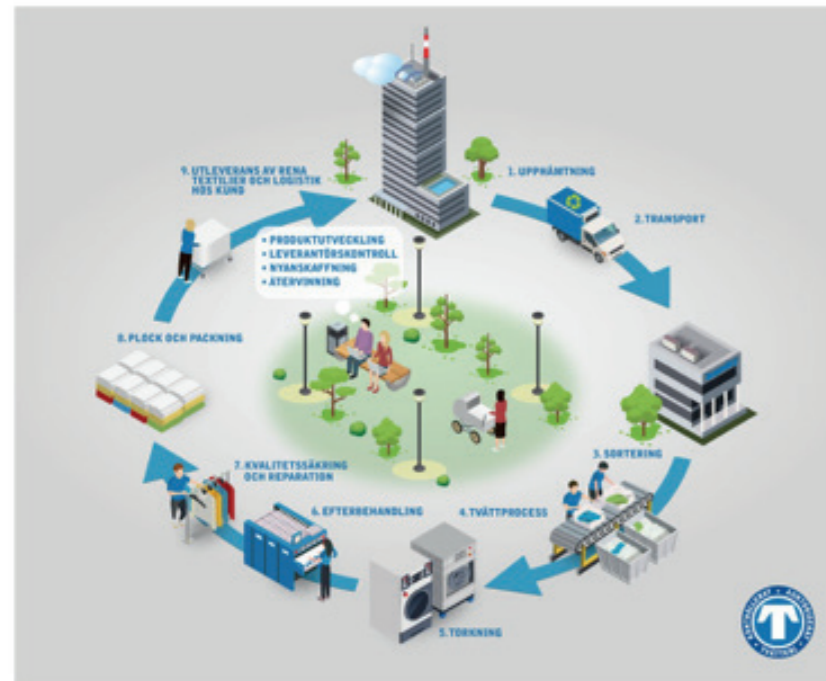
En grön cirkulär näring

och miljö. Vi gillar upphandling, konkurrens och mångfald samt tror på ett inkluderande samhälle. De professionella och auktoriserade tvätt- och textilserviceföretagen är en bransch med cirka 5000 medarbetare och vi anställer många unga, många utan färdig utbildning och många som är utlandsfödda. Vi ser vår mångfald som en styrka och våra medarbetare som vår största tillgång. Det gör oss till en viktig instegsbransch.