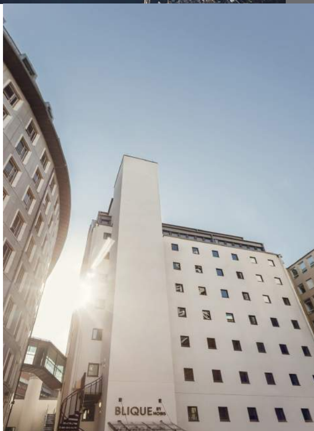
Fotograf Beatrice Graalheim. Läs mera här www.bliquebynobis.se/ .